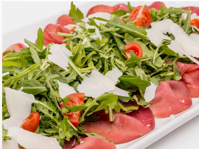
"Carne Salada" Carpaccio von Bresaola u. Rucola