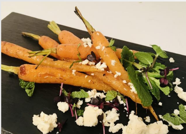
Bio-Babykarotten in Honig-Limonenmarinade

kreative Antipasti - kalorienarm und köstlich