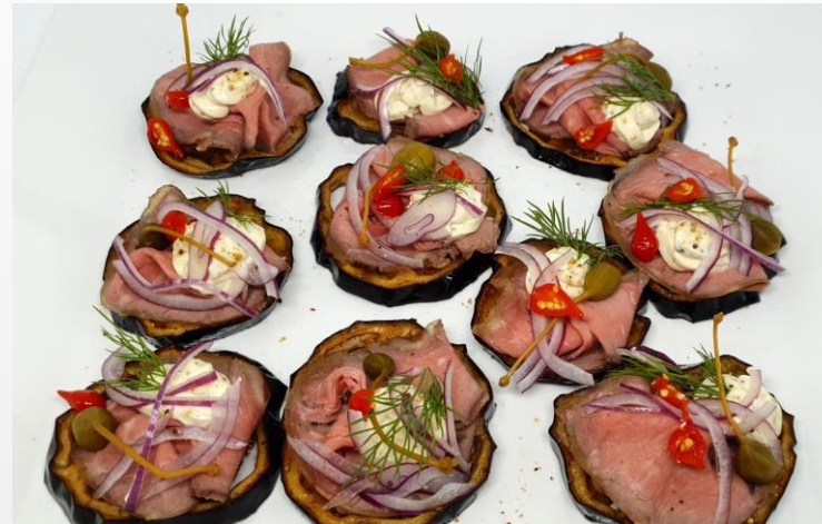
Roastbeef mit Sauce Remoulade auf gebrat. Auberginen