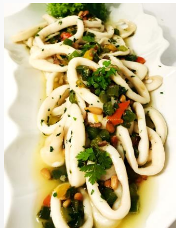
Calamari mit Paprika und Pinienkernen