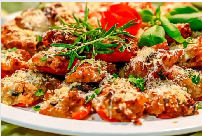
Gebackene Paprikaschifferl mit Ciabattacrunch