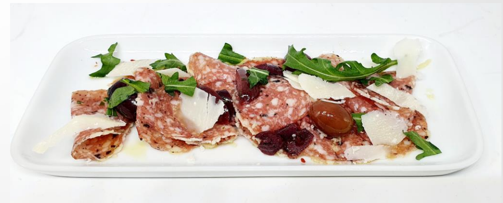
Saltufocarpaccio mit Kalamataoliven, Parmesanspalten und Trüffelöl | 4,90€