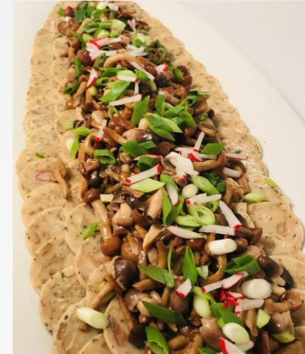
Veg. Semmelknödelcarpaccio mit Radieserl und Pfifferlingen