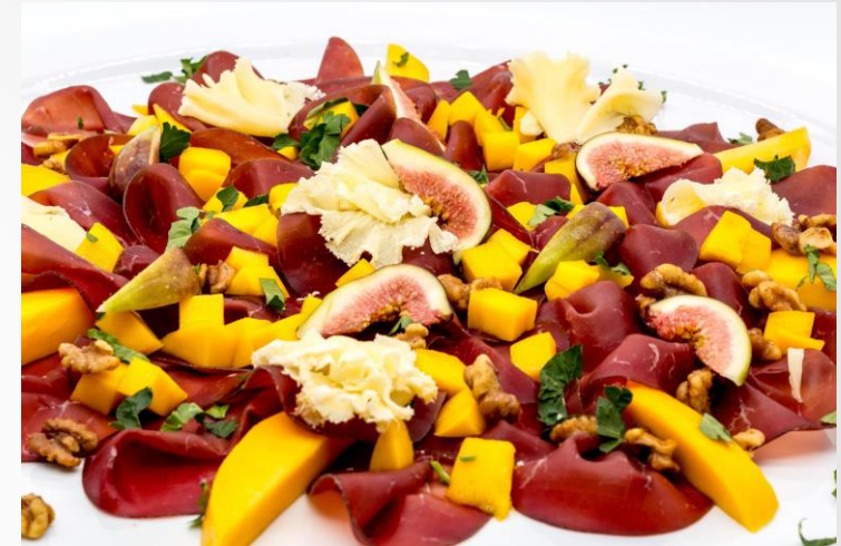
Bresaola e Mango mit Walnüssen, Käselnelken u. Feigen