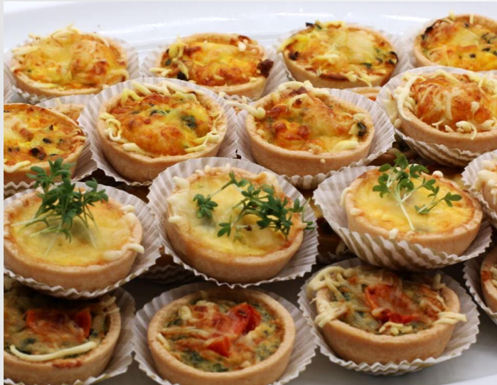
GEBACKENE MINIQUICHES Stk | 2,00€