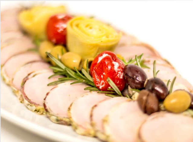
Schweinefilet "Paris" im Kräuter-Speckmantel