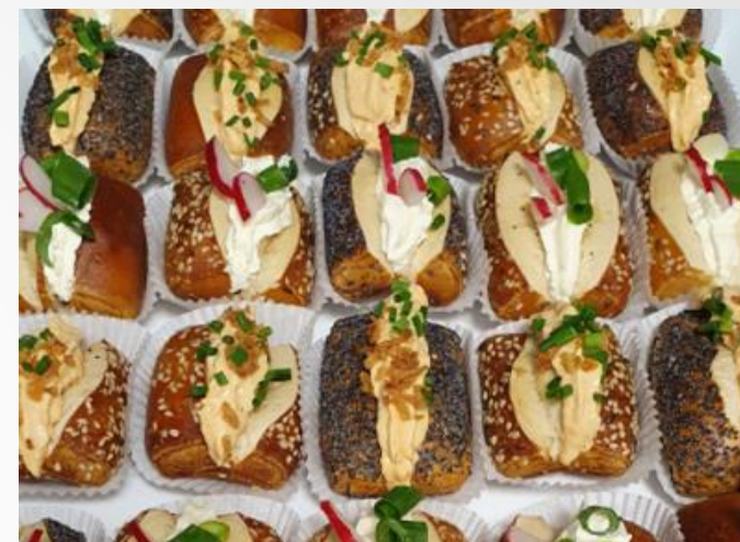
BAYR. LAUGENKONFEKT (mind. 10 Stk/Sorte)