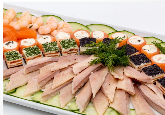
Gem. Fischspezialitätenplatte mit Räucherlachs, Räucherforellenfilet, Lachs- u. Makrelenpralinen