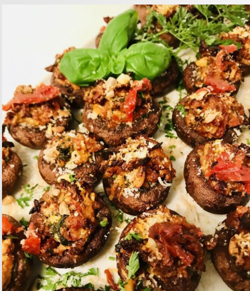
Bio-Champignons mit Gemüsetatar und Parmesan überbacken