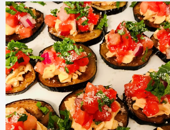
Auberginentürmchen mit Frischkäse