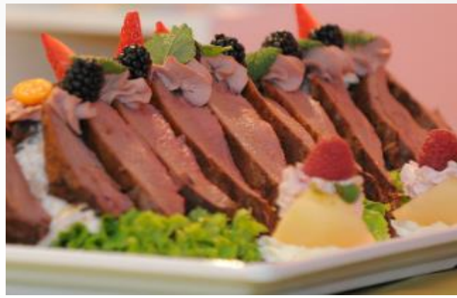
Rehrücken an Waldorfsalat m. Preiselbeerbirnen