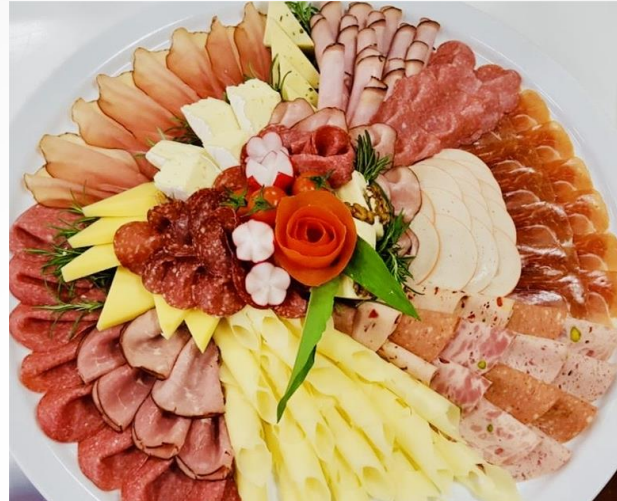
gem. Brotzeitplatte mit Frischwurst-, Salami-, Schinken- und Käseaufschnitt schön garniert