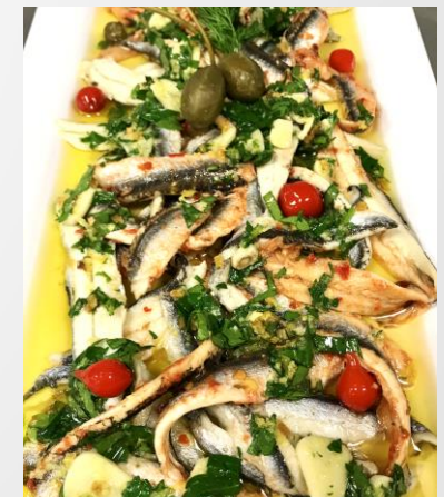
Alici-Sardellen in Knoblauch-Limonenöl