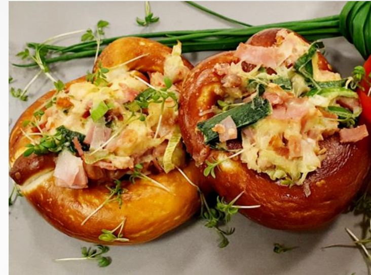
MINIBREZEN ÜBERBACKEN Stk | 2,50€