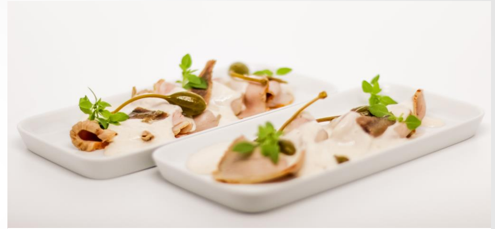
Vitello tonnato vom Kalb in Thunfischsauce mit Kapern u. Sardellen | 5,90€