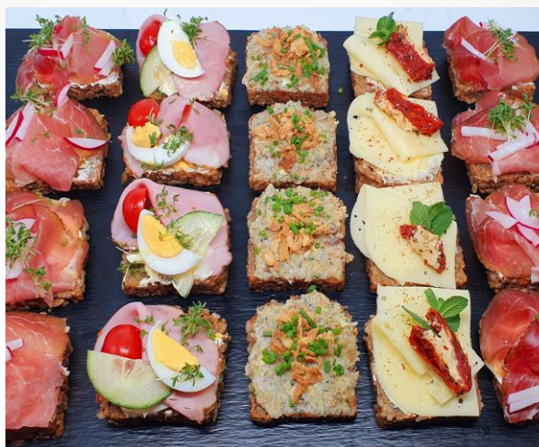
VITALBROTE (10 Stk/Sorte)