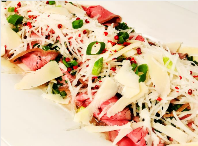
Tagliata v. Roastbeef mit Kräutern u. Parmesan

aus regionalem Premiumfleisch unserer bäuerlichen Partnerbetriebe