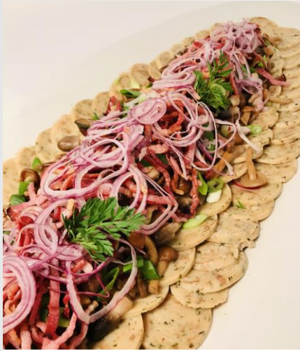
Sammelknödelcarpaccio mit Speckstroh und Pfifferlingen

Heimat is a Gefui - bei uns kann ma's sogar schmecka!