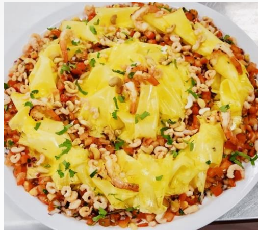
Ananascarpaccio mit Tomatensalsa, Cashewkernen, Garnelen und Shrimps