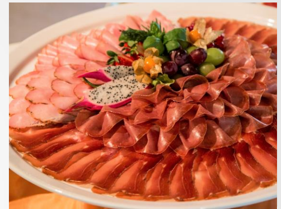
Ital.. Schinken- und Salamispezialitäten