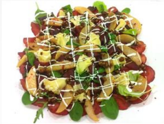
Bresaola mit Birnen, Maroni und Schmand