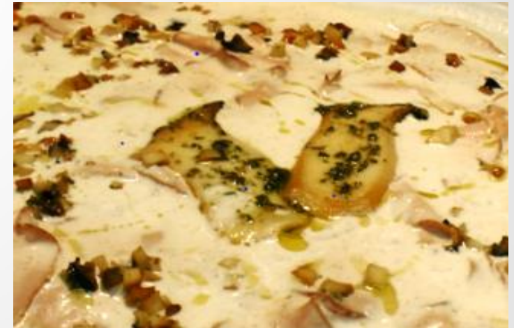
Schweinelendchen in Trüffelsahne mit gebrat. Pilzen