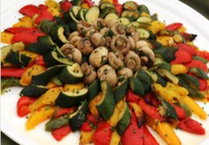
Grillgemüse von Paprika, Zucchini & Champignons

kreative Antipasti - kalorienarm und köstlich