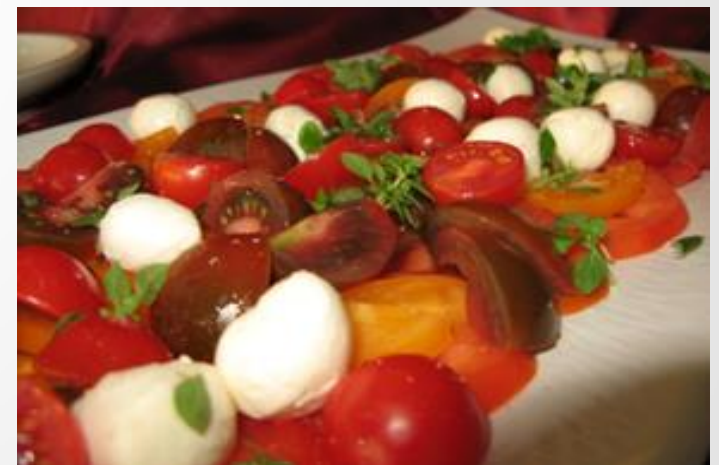
Bunte Tomatenplatte mit Büffelmozzarella