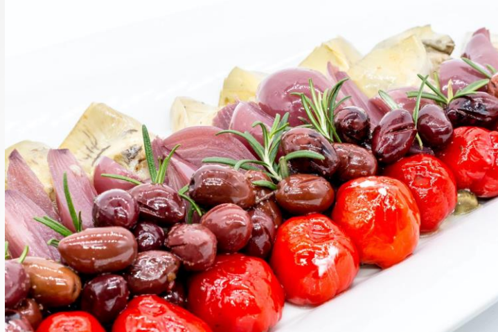
"Antipasti misti" - Kirschkaprika, Oliven & Artischocken