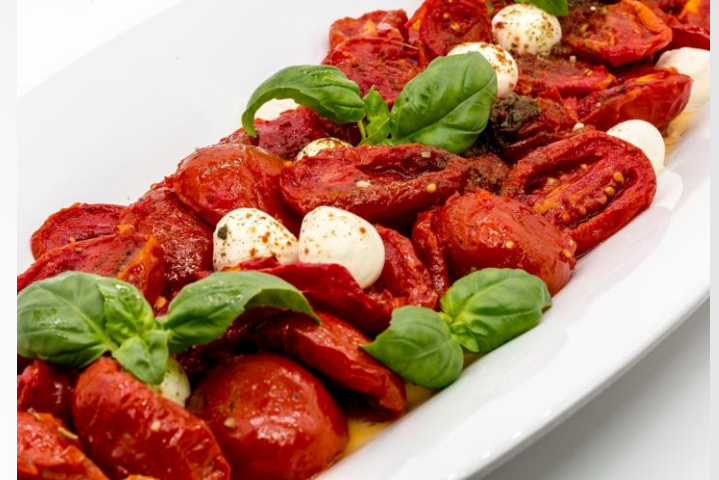
Halbgetrocknete Tomaten mit Büffelmozzarella