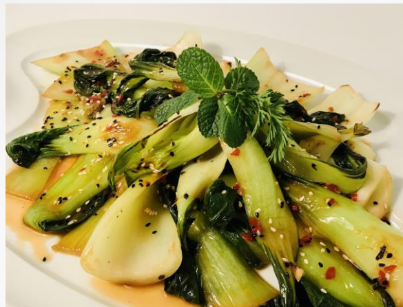
Gebrat. Pakchoi in Sesam-Sojavinaigrette