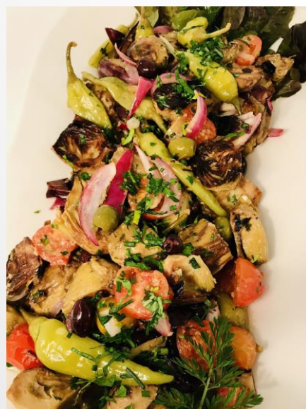
Antipastigemüse mit Auberginen, Artischocken & Pepperoni