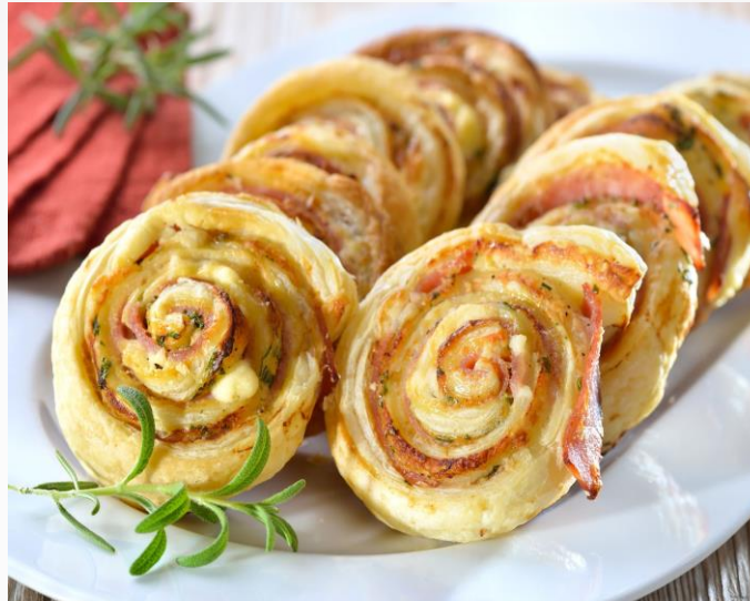
BLÄTTERTEIGSCHNECKEN Stk | 2,00€