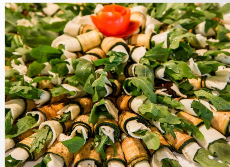
Zucchinirollchen in Knoblauch-Kräuteröl mariniert mit Mozzarella und frischem Rucola gefüllt