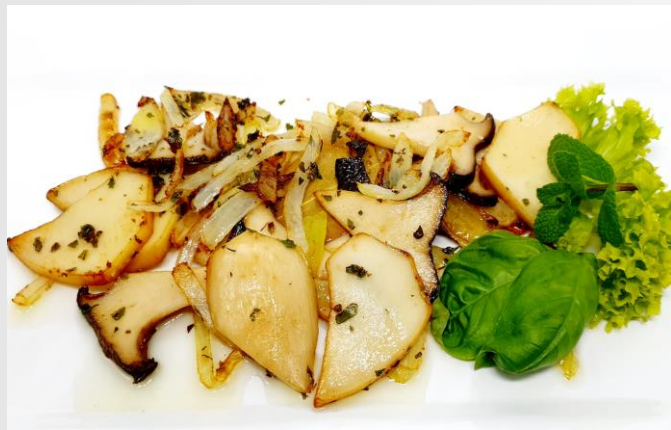
Kräuterseitlinge in Weißwein-Zwiebelöl konfiert

kreative Antipasti - kalorienarm und köstlich