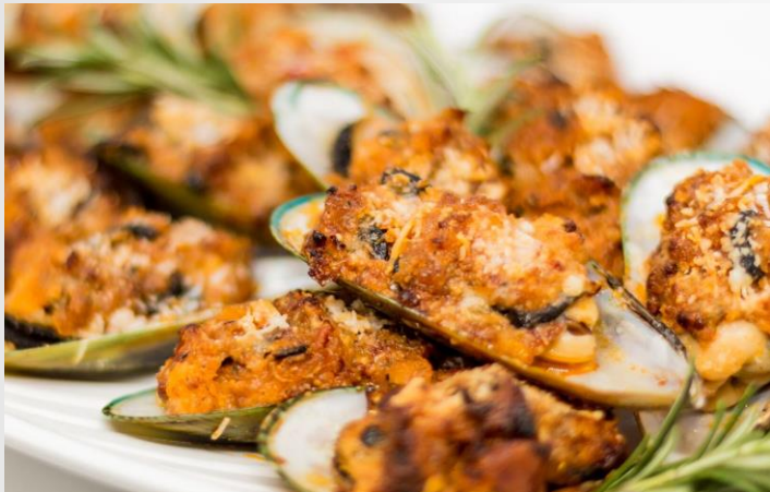
Gratinierter Grünschalmuscheln mit Ciabatta Bruschetta-Haube und Parmesan

aus nachhaltigem Fang / Bio- oder MSC-zertifiziert