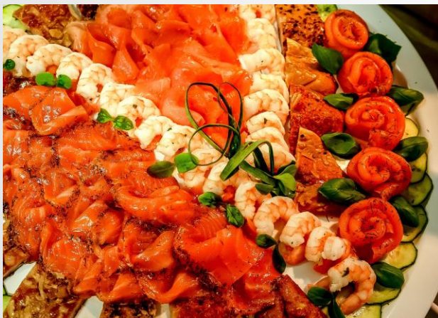
Gem. Lachsspezialitätenplatte mit Räucher-Graved-, Zitronenlachs und Lachspralinen