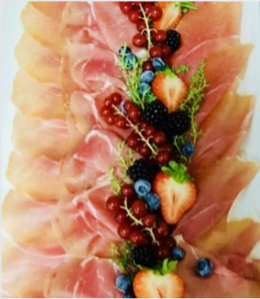
Parmaschinken hauchdünn geschnitten mit bunter Melonenplatte

aus regionalem Premiumfleisch unserer bäuerlichen Partnerbetriebe