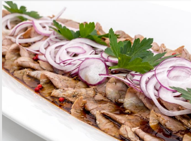
Gek. Rindercarpaccio in Balsamicovinaigrette