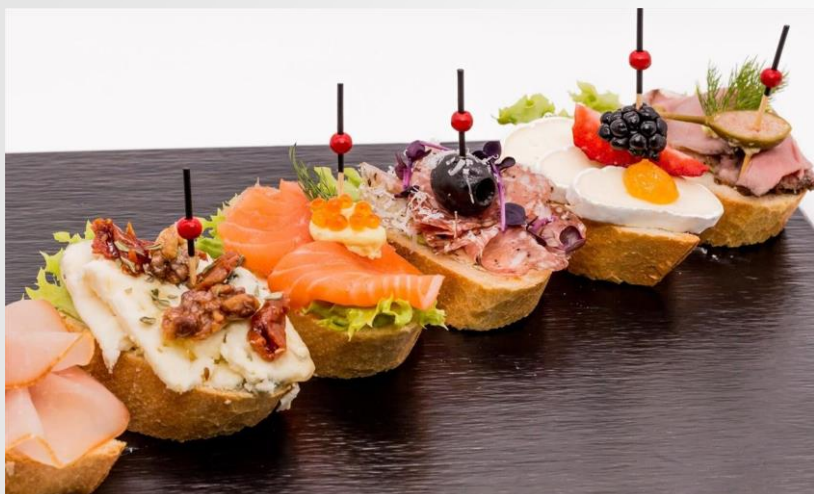
CLASSIC CANAPÉS (10 Stk/Sorte)