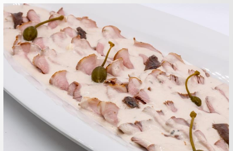
Vitello tonnato vom Kalb in Thunfischsauce mit Kapern