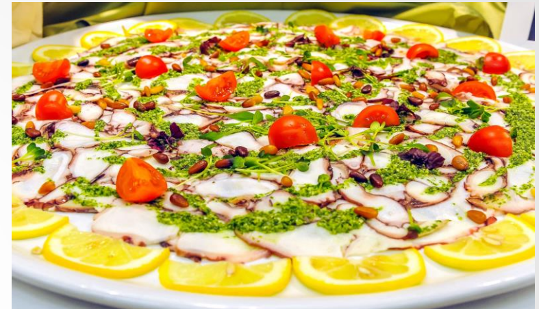
Pulpcarpaccio mit Rucola-Petersilienpesto, Limonenöl, frischen Sprossen und Pinienkernen