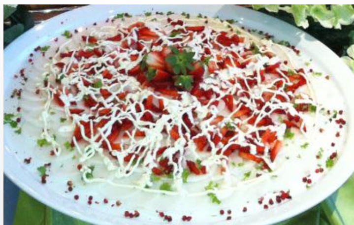
Erdbeer-Rettich-Carpaccio mit Limettenschmand