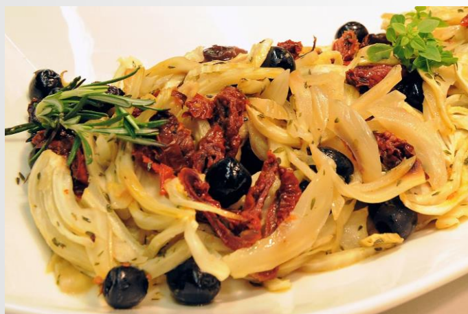
Gebratener Fenchel - mit sautierten Oliven