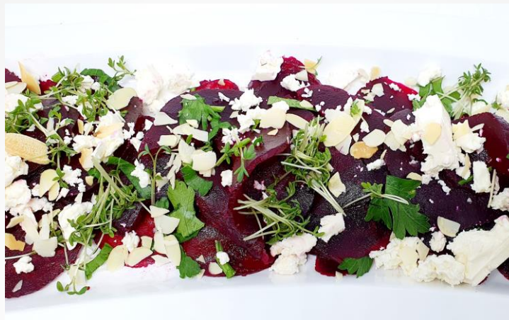
Rote-Bete-Carpaccio mit Feta, Mandeln u. Kräuterdip