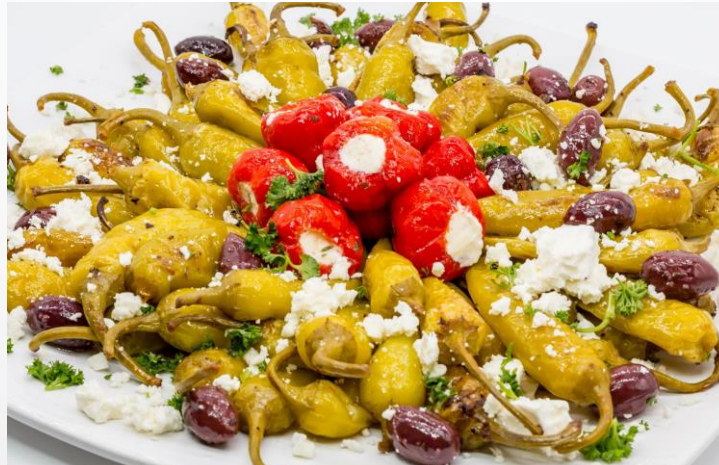
Gebrat. Peperoni in Knoblauch-Kräuteröl mit Feta