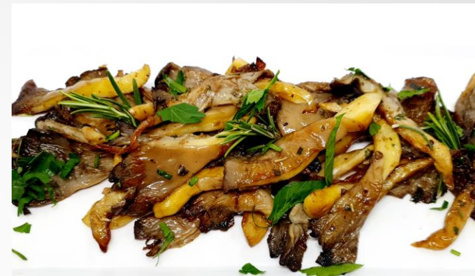
Gebrat. Austernpilze mit Balsamico abgelöscht