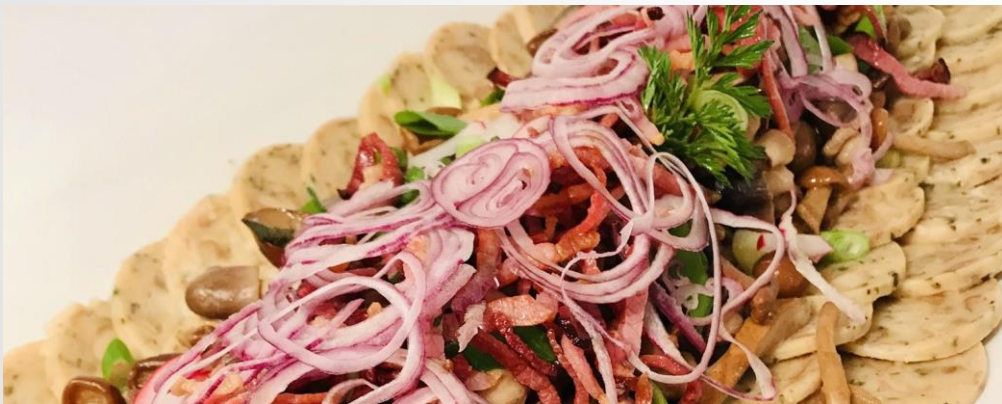
Knödelcarpaccio mit Speckstroh, Pfifferlingen und Senfvinaigrette | 4,90€