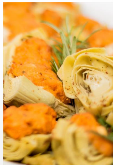
Artischocken mit Ajvarhaube