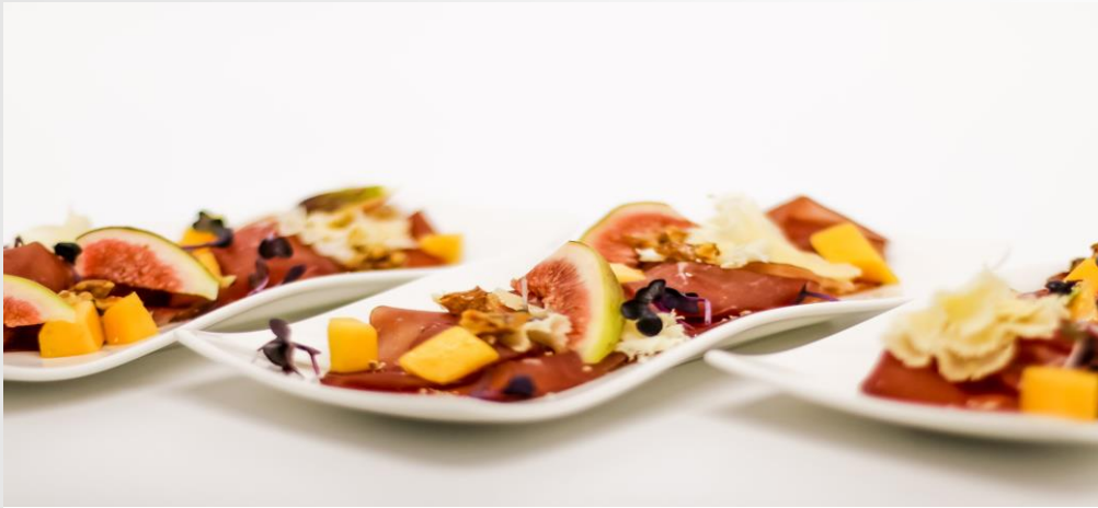
Bresolacarpaccio mit Mango, Tete de Moin u. Passionsfruchtdressing | 5,90€